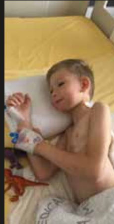
Nach der OP

Und unsere Fastenaktion ging - überraschend - noch weiter!